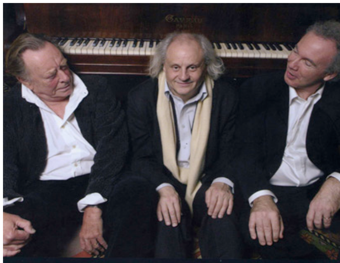
© Philippe Delacroix MENTION ET DROITS OBLIGATOIRES